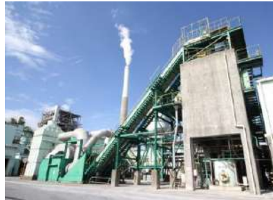
山口エコテック(株) ホームページより抜粋