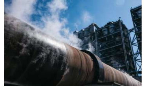
(株)トクヤマ ホームページより抜粋