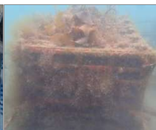
鋳鉄藻礁