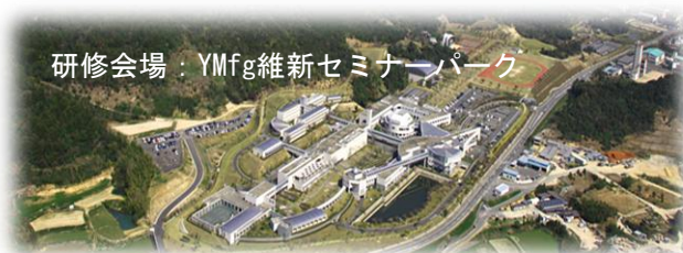
研修会場：Ymfg維新セミナーパーク