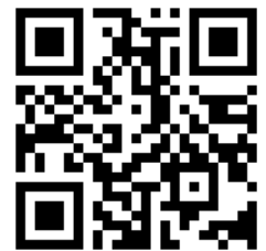
山口県ひとづくり財団HP